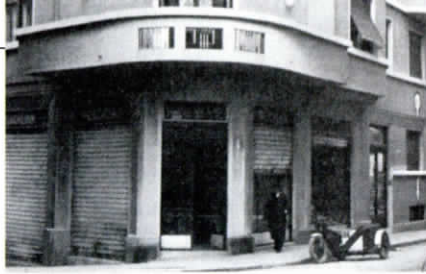
Vecstanovanjska palača v Rossettijski ulici 31. v Trstu, v kateri se je zgodil zločin.