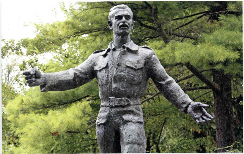
Spomenik Karla Destovnika - Kajuha v Šoštanj