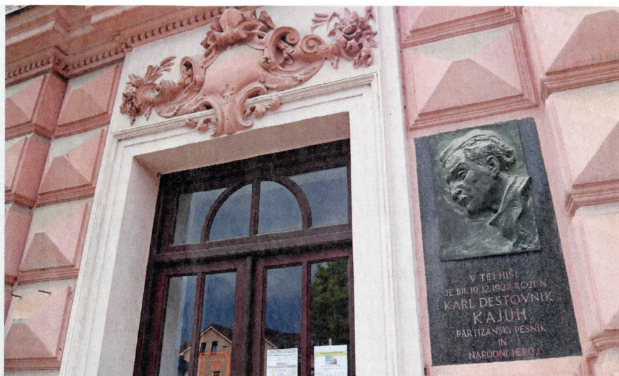
Spominska plošča na rojstni hiši Karla Destovnika - Kajuha v Šoštanju

V najbolj kočljivem trenutku sta se pojavila pred nama dva italijanska karabinjer-