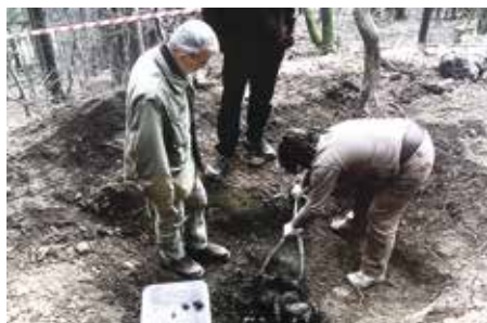
Izkopavanje: arheolog in antropologinja.