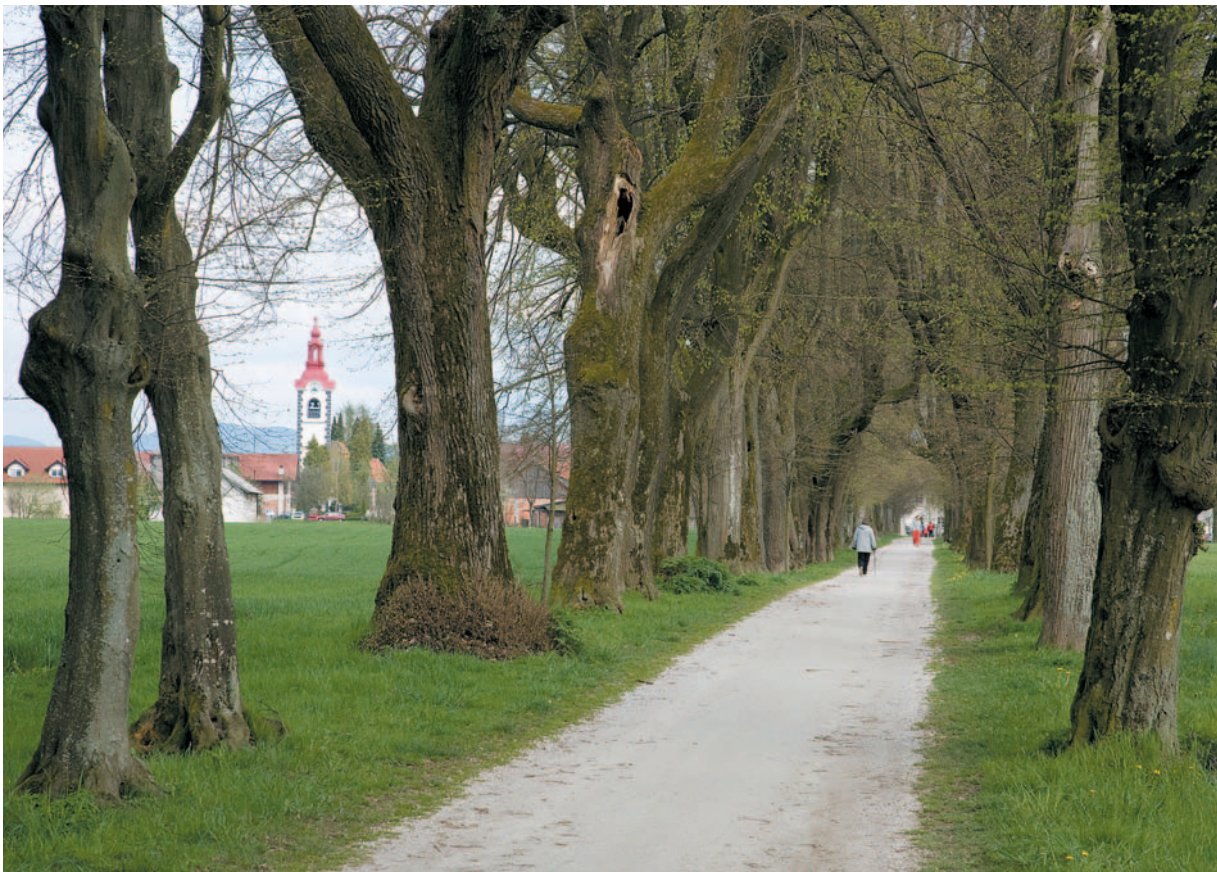
Zahodni drevored 59 je spomin na nekdanjo parkovno ureditev v Grobljah