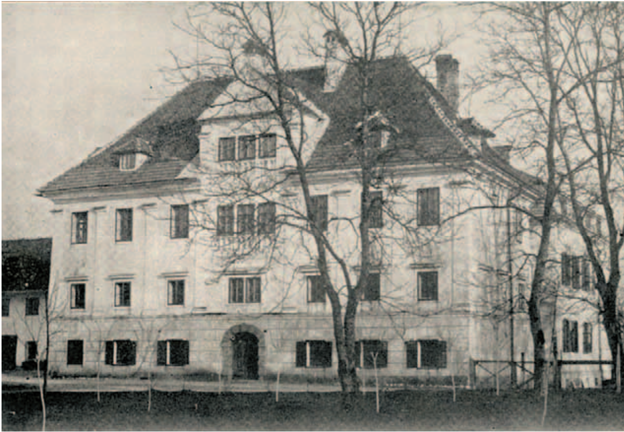
Grobeljski dvor z dozidanim delom misijonišča, 30-ta leta 20. stoletja (po razglednici v NUK-u v Ljubljani)