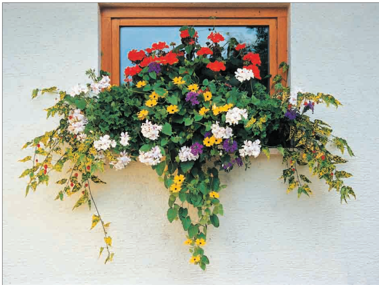
Leto 2004 – bogat, pisan šopek poletnega cvetja.