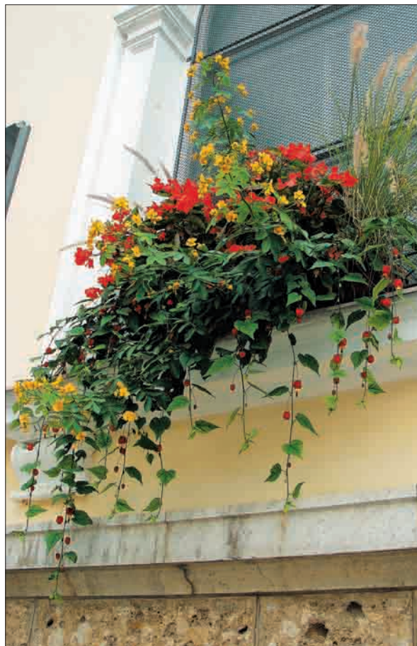
Izzivi so navdih za kreacije.