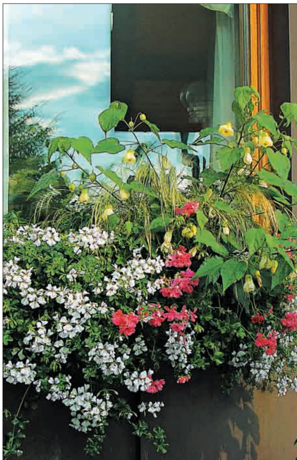
Leto 2005 – Premišljen barvni preplet.