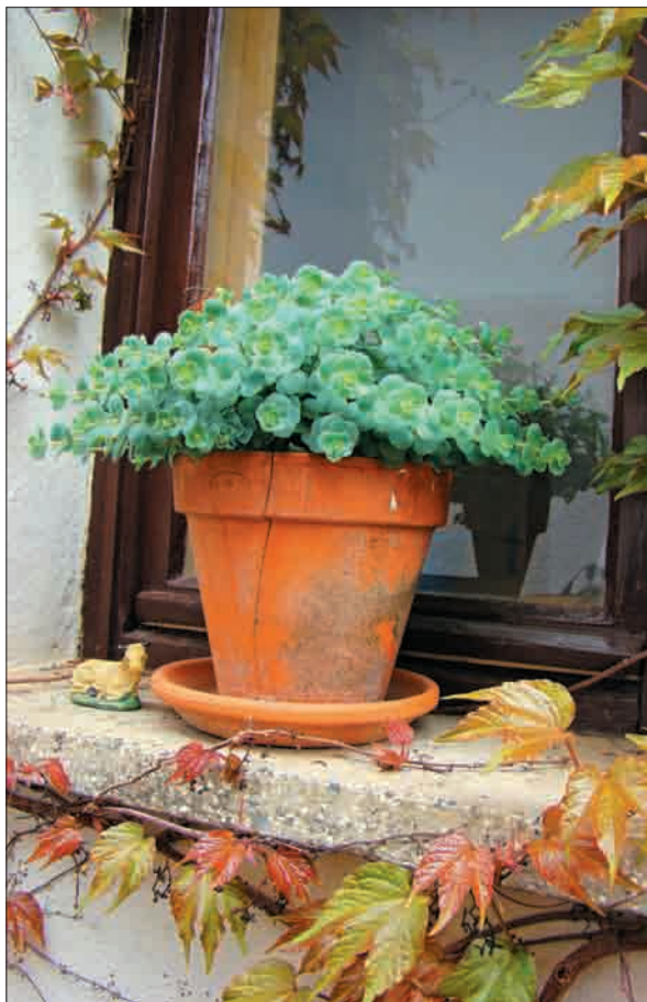
Rada imam lončke in pozabljene rastline.