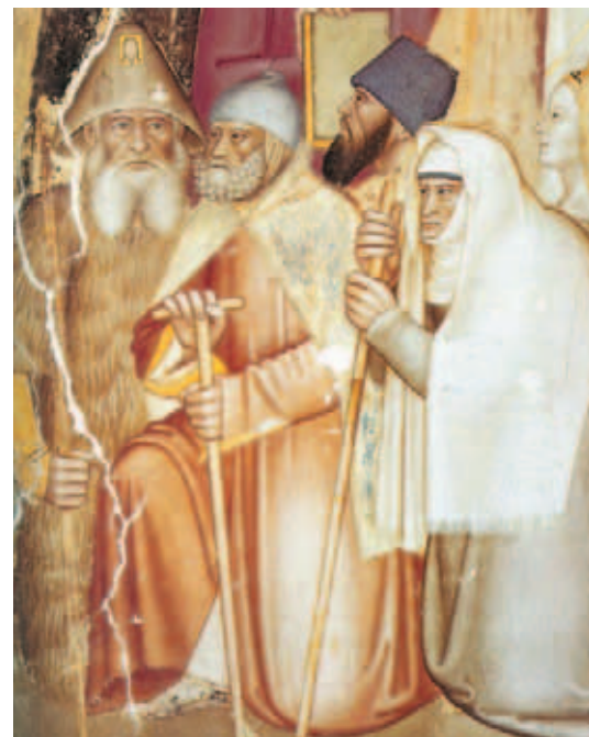
Andrea Bonaiuti: Romar in ostareli berači (detajl freske iz cerkve Santa Maria Novella v Firencah, 1365,).

Romanja poznajo skorajda vsa verstva na svetu in se torej po svojih »sestavnihi« prvinah, obredih in v praksi lahko precej razlikujejo, motivi in