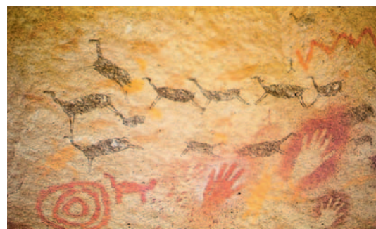
Prazgodovinske risbe z votivnim značajem (Santa Cruz v Argentini 7300 pred Kr.).

Težko pa je reči, kdaj in ob kateri priložnosti lahko začnemo govoriti o romanju oz. o romanju kot stalnem, če že ne množičnem pojavu. Nakazano je že bilo, da romanje ni »krščanska« iznajdba, saj nekakšno obliko romanj poznajo že Egipčani (Amonovo svetišče), Grki (Olimp, Delfi-preročišča), Rimljani (svetišča v čast Diani). 15 Romajo tudi verniki nekrščanskih verstev (hindujci imajo glavno romarsko središče v Bena-