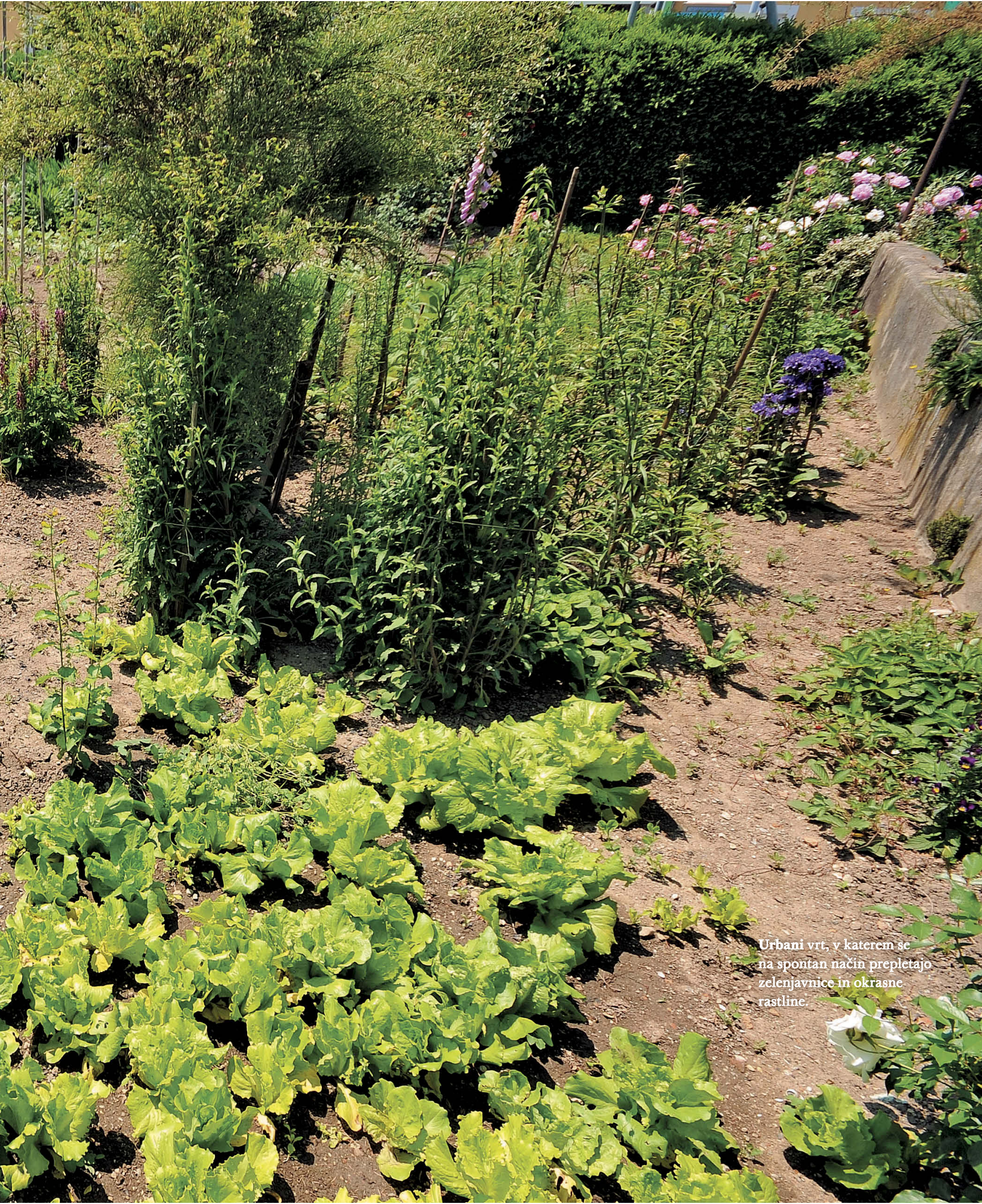
Urbani vrt, v katerem se na spontan način prepletajo zelenjavnice in okrasne rastline.