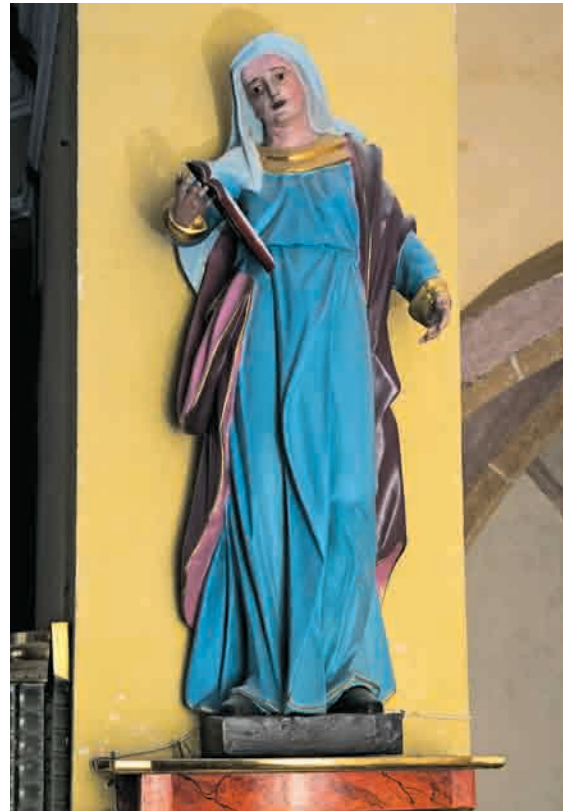
Kip sv. Ane