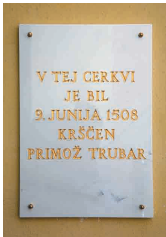
... leta 2008 ob 500-letnici