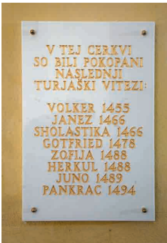
Spominski plošči sta bili postavljeni ...