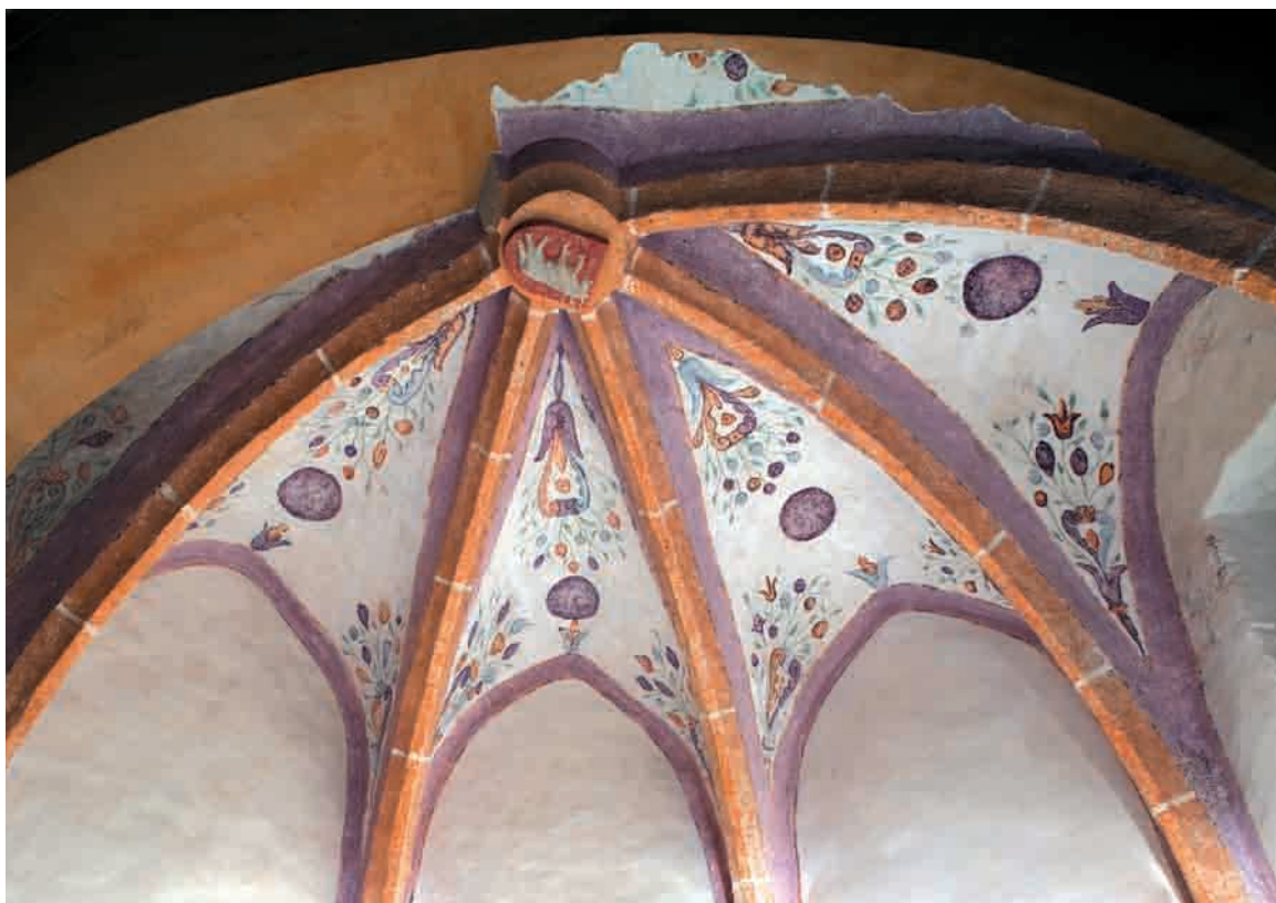
Freske so bile restavrirane leta 2009