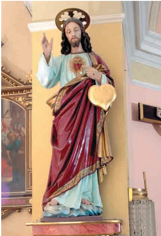
Kip Srca Jezusovega