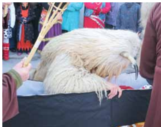
Pokojniku se poklonijo tudi žalujoči kurenti.