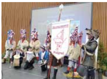
Podgrajski škoromati na turistični prireditvi v Ljubljani