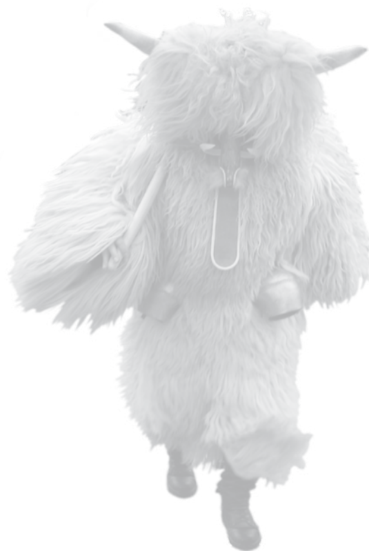
Skupine iz Rogoznice in od drugod se zgrinjajo v mesto.

Spremembe se kažejo že pri opravi, kurentiji – za številne bolj prav korantiji – kar je navzven najbolj vidno pri tleh: namesto nekdanjih težkih domačih škornjev in