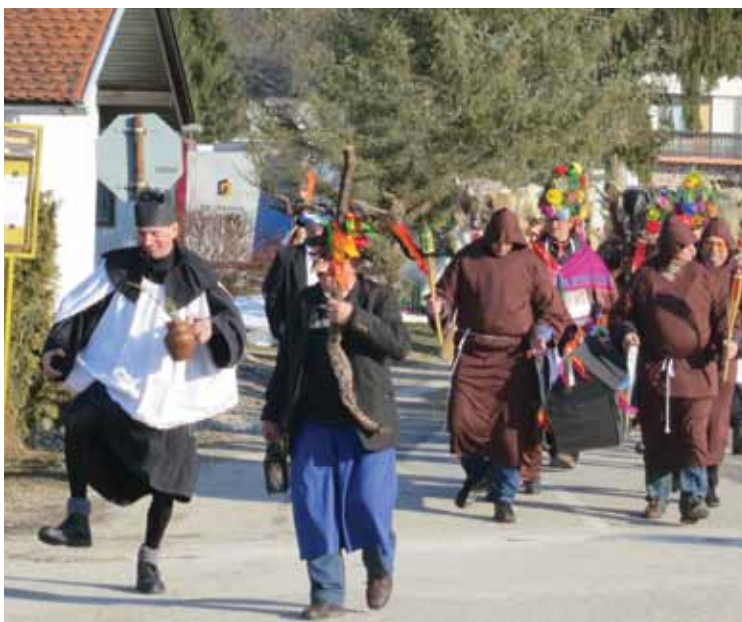
Žalostno-veseli pogrebni sprevod