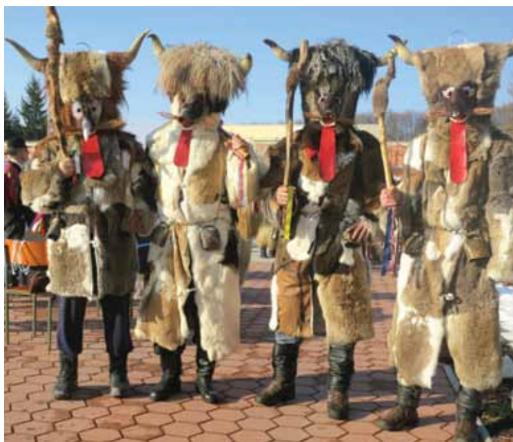
Podlehniški „zajci“ – napravljeni kot nekdanji kurenti

So pa tudi izjeme, ki se ne prepuščajo prevladujočemu toku. Na primer v Podlehniku, vasi v osrčju Haloz, kjer kar osemnajst društev po svoje skrbi za ohranjanje krajevne kulturne dediščine. Tudi njihovi koranti s spremljevalnimi skupinami se udeležijo najbolj množičnega shoda na Ptuj in kdaj pa kdaj gredo še kam, vendar so razen dneva ali dveh – od trenutka, ko pokarji zavihitijo svoje biče, do slovesa od pokojnega Pusta , Fašenka , in slovesne upepelitve njegovega trupla –, doma, med svojimi. Vračajo se tudi k bolj avtentični opravi iz časov, ko so si mladeniči sami pripravili opremo iz kož, oblačil in obuval, ki so jih imeli pri roki na kmetiji. Dokler v okolici Ptuja niso gojili ovac oziroma si niso mogli privoščiti ovčjih kožuhov iz drugih predelov nekdanje Jugoslavije, so imeli krajša, le do kolen segajoča oblačila predvsem iz