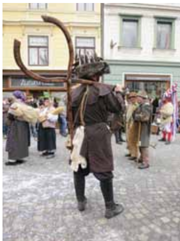
Kleščar čaka na svoje.

Niko Kuret opozarja, da je maskiranje v Evropi na renejši odpor naletelo šele v obdobju reformacije, po robu pa se mu je postavilo tudi razsvetljenstvo, vendar pa različne uredbe in omejitve niso segle čez mestne meje, tako da je „na deželi starodavno izročilo, v stoletjih mnogokrat predrugačeno, živel naprej”. Kurentom, našim najznamenitejšim maskiranim likom, je bil na primer še pred dobrimi šestdesetimi leti prepovedan vstop v ožje območje Ptujja, v zadnjih desetletjih pa se je prav naše najstarejše mesto razvilo v največje karnevalsko središče v tem delu Evrope.