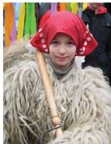
Kurentija je naporna reč ...