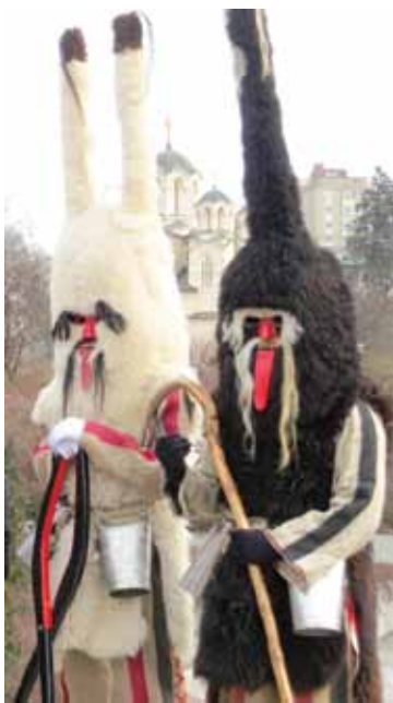
Vrbiški šjmi, Črni in Beli lovec