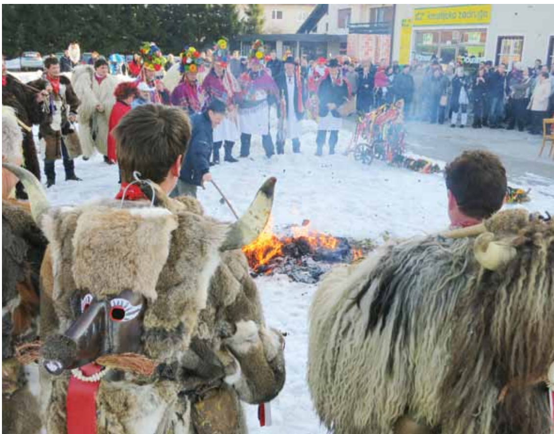
Fašenk izginja v plamenih.

Nekatera razmišljanja Zlatka Gajška pa so tudi manj optimistična in spodbudna: