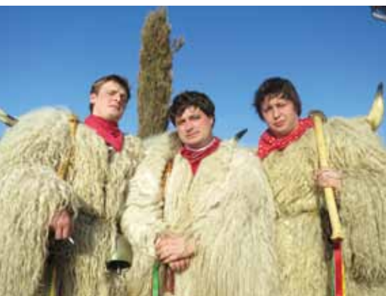
Ovčjega kožuha si некоč ni mogel privoščiti vsakdo.