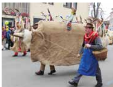
Na ptujskem karnevalu nastopa tudi Rusa.

našem informacijsko prepletenem in povezanem ter obnem vedno bolj razrvanem 21. stoletju ta spomin ohranjajo pri življenju, se o prastarih koreninah svojega početja večinoma ne sprašujejo. Tisti, ki jih ni tako ali drugače zajela komercializacija, se prepuščajo toku, nastopajo, tekmujejo in si izmišljajo različne dodatke, da bi bili še bolj opazni, nekateri pa vendarle ostajajo ob robu in se v pustnem času posvečajo predvsem sebi. Če se že udeležijo katerega od množičnih karnevalskih prireditev v domovini ali na tujem, tam pač nastopajo in se večinoma tudi uklonijo pričakovanjem prirediteljev, doma pa se počutijo samo doma, v svojem okolju, med svojimi ljudmi. Ker so tako sami s seboj, se nemalokdaj tudi sprejo, tako da obhodov kakšno leto ali tudi več ne pripravijo – dokler jih sčasoma toliko ne pogrešajo, da jih, okrepljeni z mlajšimi močmi, spet obnovijo.