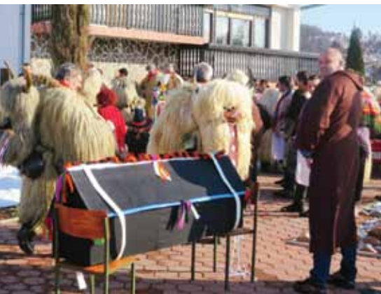
Podlehniški pogrebci se zbirajo.

So pa tudi izjeme, ki se ne prepuščajo prevladujočemu toku. Na primer v Podlehniku, vasi v osrčju Haloz, kjer kar osemnajst društev po svoje skrbi za ohranjanje krajevne kulturne dediščine. Tudi njihovi koranti s spremljevalnimi skupinami se udeležijo najbolj množičnega shoda na Ptuj in kdaj pa kdaj gredo še kam, vendar so razen dneva ali dveh – od trenutka, ko pokarji zavihitijo svoje biče, do slovesa od pokojnega Pusta , Fašenka , in slovesne upepelitve njegovega trupla –, doma, med svojimi. Vračajo se tudi k bolj avtentični opravi iz časov, ko so si mladeniči sami pripravili opremo iz kož, oblačil in obuval, ki so jih imeli pri roki na kmetiji. Dokler v okolici Ptuja niso gojili ovac oziroma si niso mogli privoščiti ovčjih kožuhov iz drugih predelov nekdanje Jugoslavije, so imeli krajša, le do kolen segajoča oblačila predvsem iz