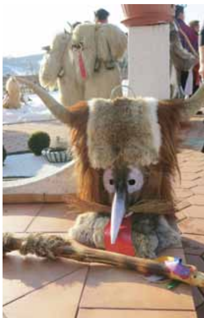
Ježevka je nujni del oprave.