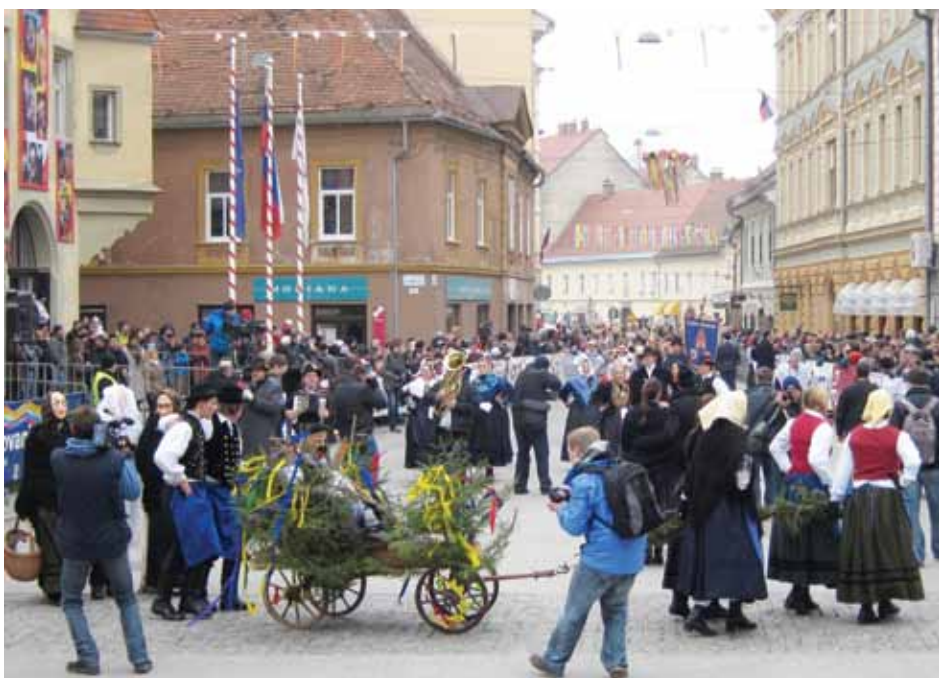
Mimohod Ploharjev iz Cirkovc na Ptuj