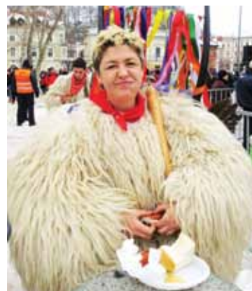
Kurentinja na Kongresnem trgu v Ljubljani

Kurenti opazujejo spretnega mladega pokarja.