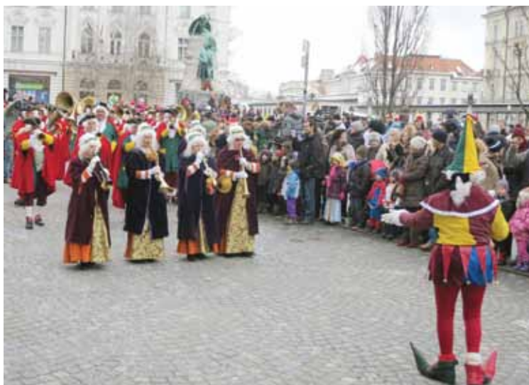
Tminska pustna muzika na Prešernovem trgu v Ljubljani