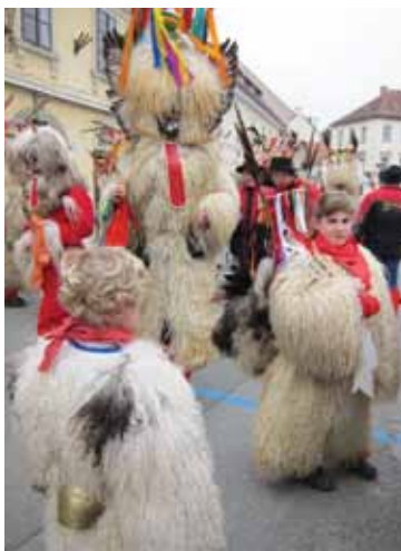
Danes se izpod mask pokažejo tudi otroški obrazi.

Nekoč so si kurenti sami naredili opravo iz tistega, kar je bilo pri hiši. In sami so si morali pridobiti pisane robce – tudi zgrda, če ni šlo zlepa – kot odkupnino deklet, ki so jih ulovili. Kdor je imel za pasom ali na ježevki pritrjenih več robcev, je bil bolj spoštovan; zdaj si nastopajoči pripenjajo kar kupljene cunjice. Svojčas so se kurenti delili na dve večji skupini, na markovske s pernatim pokrivalom in haloške z rogovi, v zadnjem času, ko prihajajo skupine tudi iz drugih vasi, so razlike med njimi že precej zabrisane. Sprva so smeli biti kurenti le neporočeni fantje, saj je imelo njihovo rogoviljenje tudi globlji simbolni pomen iniciacije in spodbujanja rodovitnosti zemlje. V novejšem času so med njimi tudi moški in čedalje več otrok, ne manjka pa niti žensk in deklet. Če je to med sprevedom še skrito, je očitno, preden si nadenejo maske, ali se pokaže, ko si jih na koncu ali že kar spotoma snamejo, da si oddahnejo.