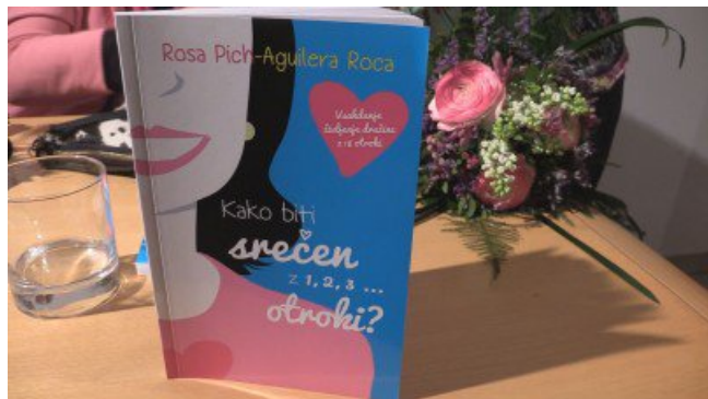
Kako biti srečen z 1,2,3 ... otroki?

Velike družine se ne da spregledati, še posebno na nogometnih tekmah, kjer navijajo za svoje brate. Kar sedem otrok tekmuje v košarki oz. nogometu. “Na tekmah glasno navijamo in spodbujamo naše športnike, radi pa gremo tudi na izlet v naravo ali na sprehod po muzeju. Tudi ko je otrok majhen, lahko gleda slike v galeriji. Če nič drugega, lahko šteje, koliko živali je na sliki,” pove energična Španka.