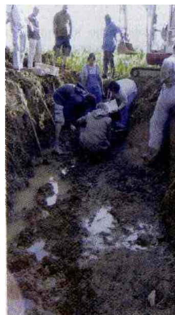
Izkopavanje skeletov v Matjaževi jami

»Za spravni proces Slovenci potrebujemo pravico vedeti, pravico do poprave krivic in pa tisto, kar je najpomembnejše, ne ponavljanje zločinov totali-