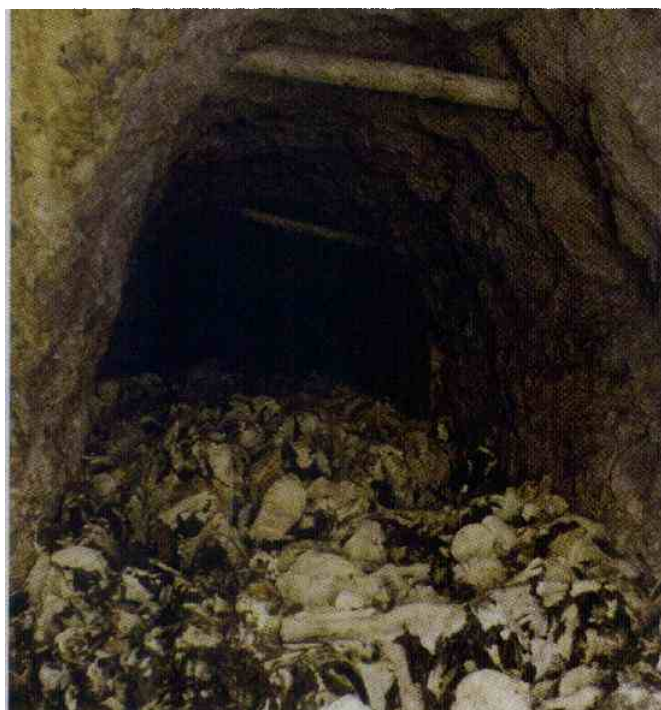
Ostanki stotin pomorjenih žrtev