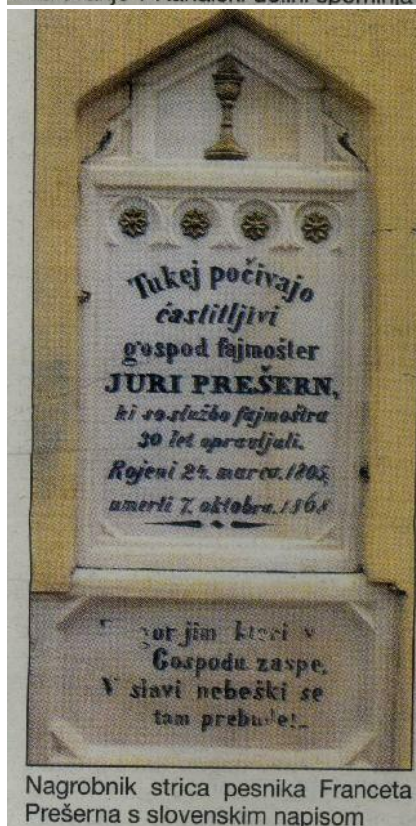
Nagrobnik strica pesnika Franceta Prešerna s slovenskim napisom

Kanalska dolina je geografsko nenavadna, ker se približno sredi doline, na zahodnem koncu vasi Žabnice, dviga razvodni prelaz, sicer najnižji v Alpskem svetu (813 metrov). Vendar določa odtekanje voda na eni strani proti vzhodu, torej preko Ziljice, Drave, Save in Donave v Črno morje, po drugi strani pa preko Bele in Tilmenta v Jadransko morje. (odlomek iz knjige)