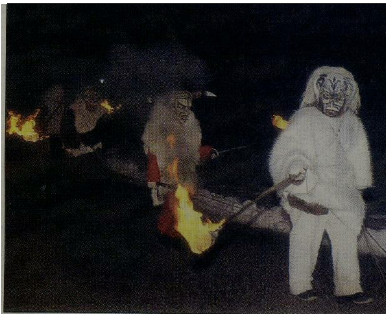
Pustovanje v Kanalski dolini spominja na predkrščanske čase