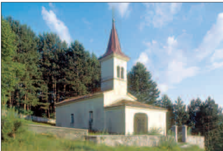
Podružnična cerkev sv. Hieronima v Koritnicah

Podružnična cerkev v Jasenu pri Ilirski Bistrici in župnijska cerkev v Branici na Vipavskem sta bili prvotno posvečeni sv. Hieronimu, pozneje pa sta dobili nov patrocinij. Po izročilu imajo v zgornji Vipavski dolini sv. Hieronima za »svojega svetnika«. Ko so leta 2003 v kapeli Matere Božje v župnijski cerkvi sv. Vida v Podnanosu ob prenovitvi gotskih fresk iz leta 1481 odkrili in očistili dvanajst kamnitih sklepnikov, so na enem odkrili podobo sv. Hieronima s knjigo v rokah, ob njem pa ležečega leva. Sv. Hieronimu sta posvečeni tudi dve tamkajšnji kapeli, prva stoji ob robu vasi Podnanos, druga pa ob cesti, ki vodi na Nanos. V župnijski cerkvi sv. Frančiška Ksaverija v bližnjih Lozicah je na glavnem oltarju kip sv. Hieronima, v podružnični cerkvi sv. Ane na sosednjem Štjaku pa ima svetnik svoj oltar. Na Goriškem je sv. Hieronimu posveče-