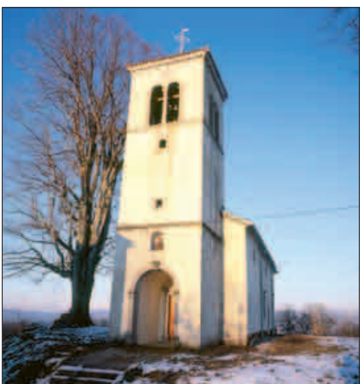
Čelje pri Premu

Podružnična cerkev sv. Hieronima nad Koritnicami pri Knežaku je bila zgrajena v 15. stoletju. Oltar je bil obnovljen leta 1890, ko so postavili tudi svetnikov kip. Verniki iz okolice se v postnem času ob petkih zbirajo k maši in spokornemu bogoslužju. Tako ima romanje z molitvijo križevega pota tudi spokorni značaj, ki je značilen za svetnikovo življenje. Romarji se sv. Hieronimu priporočajo za zdravje in srečno smrt, da bi imeli zdrave oči, pa si te umijejo bližnjem studencu. Glavni romarski praznik je na god sv. Hieronima, 30. septembra.