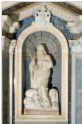
Kip sv. Hieronima v Koritnicah