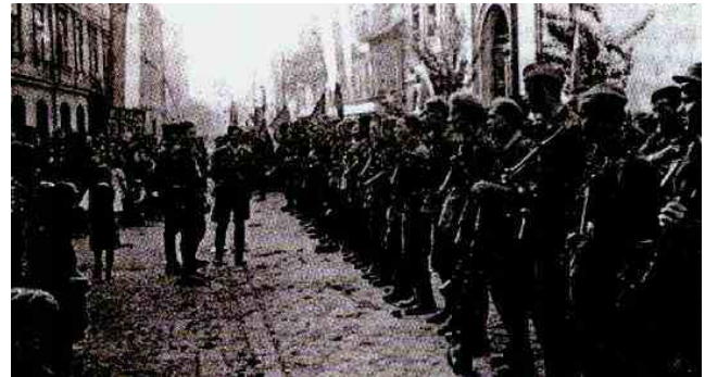
1. bataljon 3. brigade divizije KNOJ na obrežju Savinje pri Celju maja 1945