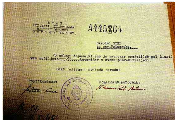
Obvestilo KNOJ iz Gorice, da pošiljajo deset vojakov in dva puškomitraljeza