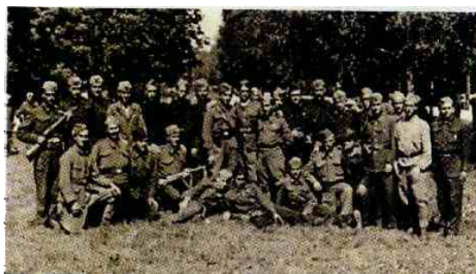
1. bataljon 3. brigade divizije KNOJ 12. maja 1945 v Celju