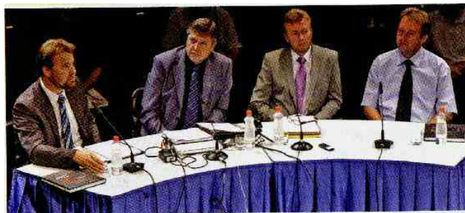
Predstavitve knjige Huda jama - skrito za enajstimi pregradami

»Vemo, da je del žrtev iz Hude jame Slovencev in da so bili prepeljani s Teharij in iz Starega piskra. Nedvomno vemo, da so del pobojev izvršile slovenske enote, da je del pobojev organizirala, koordinirala in vodila slovenska Ozna. Imamo nekatera imena ljudi, ki so pri tem sodelovali, vendar imamo kljub vsem opravljenim razgovorom in pregledovanju dokumentacije še vedno premalo podatkov, da bi lahko zoper katerega koli še živečega pripadnika enot, za katere