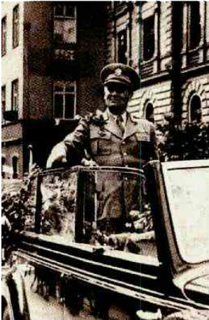
Josip Broz Tito v Celju, 30. maja 1945

so bile skoraj vse operacije. Štab 11. divizije je ta dan poročal štabu jugoslovanske vojske v Beogradu, da je »zdaj na ozemlju Celja v taboriščih 7.600 Nemcev, 4.550 ustašev, 2.709 domobrancev, 600 četnikov, 28 Poljakov in 25 Italijanov (Arhiv VII JNA, Beograd)«.