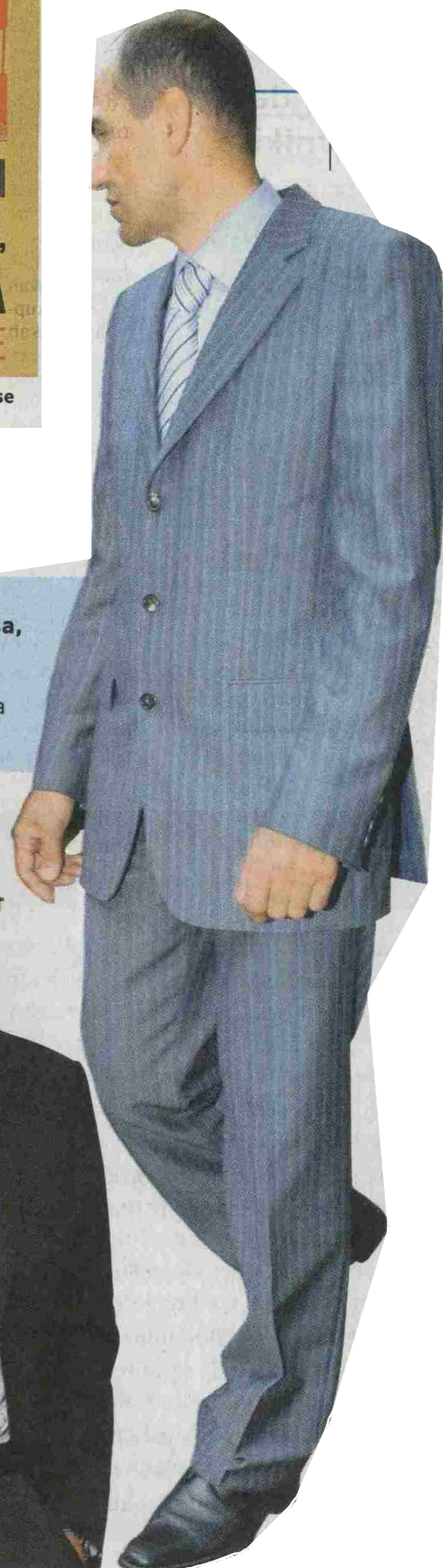
Janez Janša, ob bok Orbanu