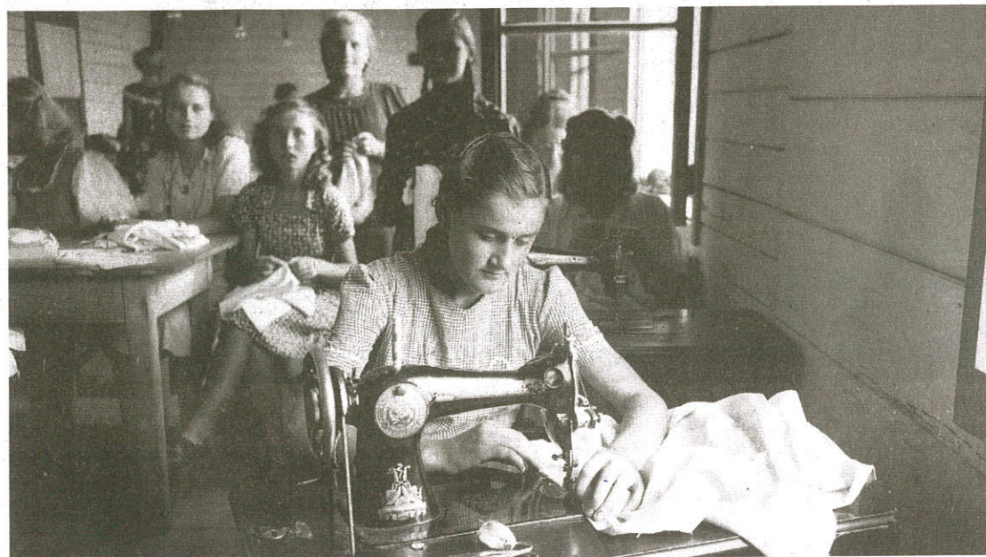
V begunskih taboriščih so organizirali številne obrtne delavnice in tečaje, kakršen je bil tudi šiviljski tečaj.

Podobe, morda presenetljivo, ne kažejo ne stiske ne žalosti. Gledalec opazuje urejene, dostojanstvene, delavne, prešerne ljudi, vključene v vsakodnevno delovanje skupnosti. To je seveda logično – fotografi so bili tudi sami begunci, in ne, denimo, zunanji fotoreporterji, ki bi zasledovali človeške stiske – morda so tudi zato nekatere fotografije celo izrazito umetniške, druge priložnostne, tretje »zrežirane«, tudi ateljejske ... A nekaj begunske tragedije se je na posamezne vseeno vtisnilo. Še zlasti na posnetke, ki prikazujejo slovo, ko so begunci začeli odhajati v svoje nove domovine. Ti obrazi izražajo žalost, negotovost in stisko, upanje, da bodo še kdaj videli svoje domove in bližnje, ki so ostali v domovini, je vse manjše. Niso se podali na pot domov, ampak na pot, na koncu katere so si morali poiskati nov dom.