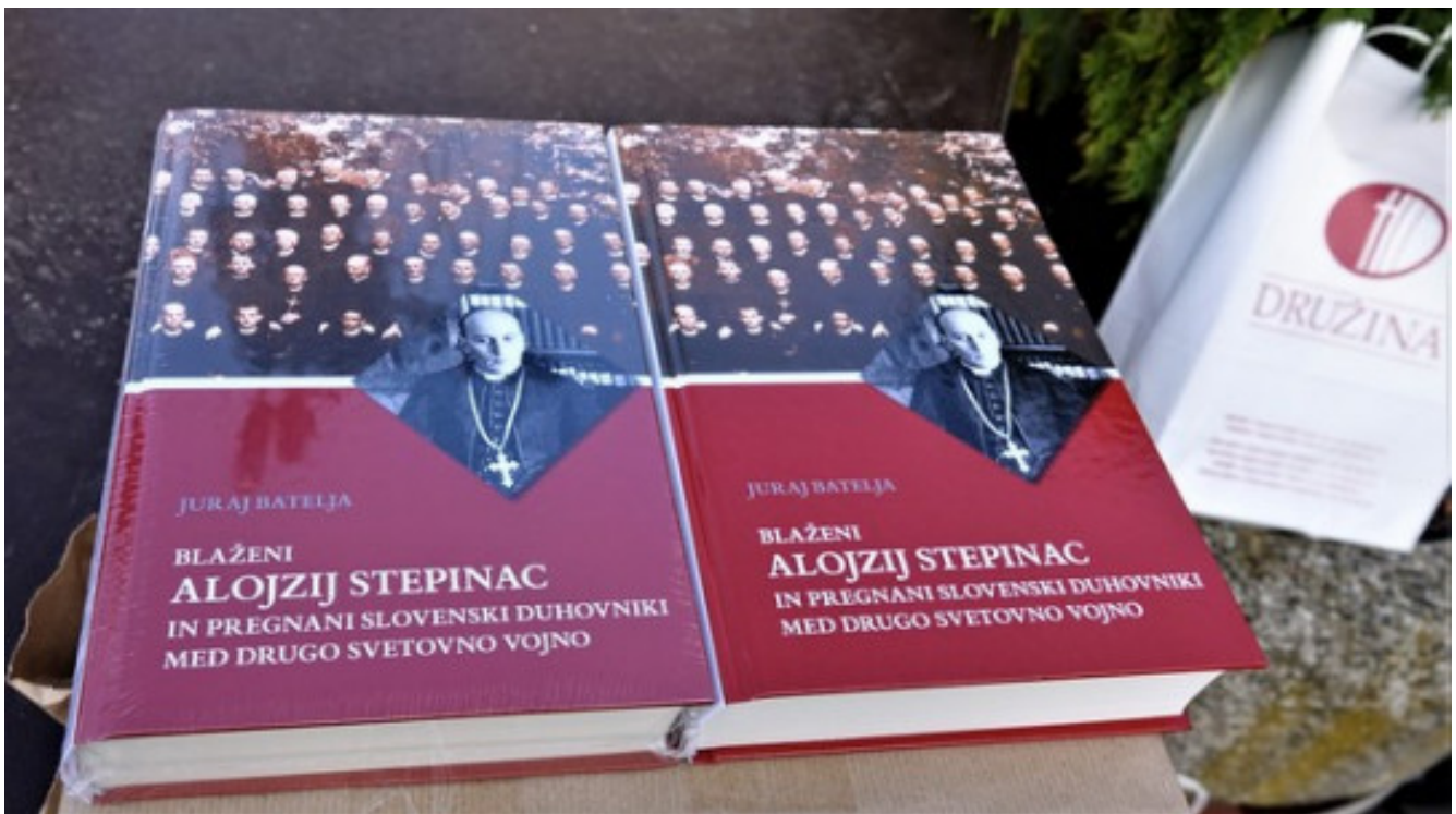
Blaženi Alojzij Stepinac

Duhovnemu programu, ki so ga pripravili bogoslovci zagrebškega in ljubljanskega semenišča, je sledila sveta maša na trgu pred cerkvijo. Že v uvodnem delu je bilo čutiti, da gre za dvojezično srečanje, saj je hrvaški himni blaženega Stepinca sledila slovenska Veš o Marija. Slovesno somaševanje je vodil zagrebški nadškof kardinal Josip Bozanić. Pri oltarju se mu je pridružilo veliko število duhovnikov ter petnajst hrvaških in sedem slovenskih škofov. Kardinal Bozanić je spomnil, da je zbrane na vseh dosedanjih slovensko-hrvaško srečanjih spremljala nebeška Mati Marija. Tokrat so se zbrali na kraju, kjer je veliki častilec nebeške Matere blaženi Alojzij Stepinac, začel zemeljsko življenje in dozorel za nebesa, je poudaril kardinal Bozanić. Spomnil je tudi na 535 duhovnikov, pregnanih iz območja, ki so ga na slovenskem ozemlju zasedli Nemci. Kardinal Stepinac jih je sprejel v svojo škofijo in tako marsikoga rešil pred smrtjo.