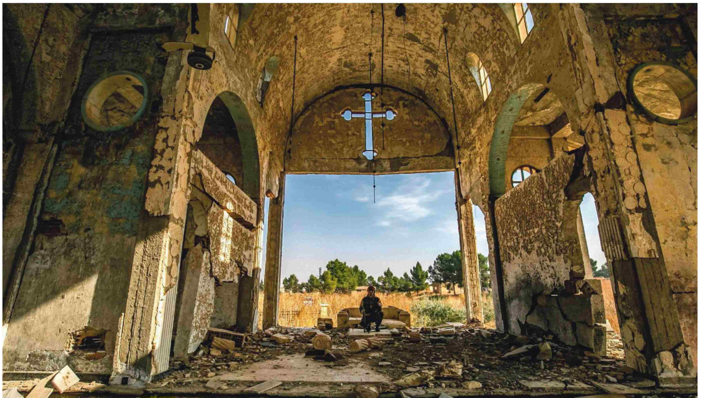
Po mnenju Piilar Rahola zahod ne obravnava islamskega sveta s kritično zrelostjo svobodne misli, temveč s »priliznjnim protekcionizmom«, s katerim se opravičujejo vsa dejanja.