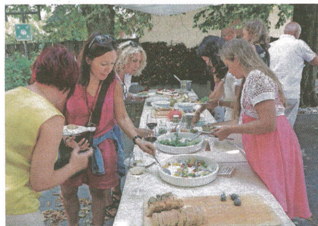
Degustacija jedi je tokrat postregla s preprostimi, a svežimi in zdravimi okusi.