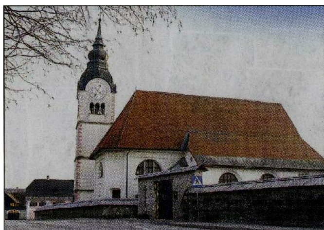
Leška cerkev je še danes priljubljena božja pot. Prvi romarji naj bi začeli hoditi v Lesce že v 12. stoletju.