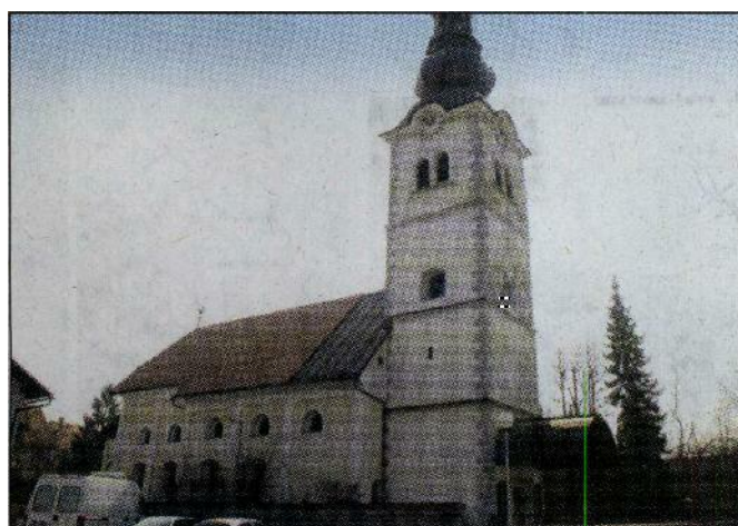
V cerkev na Primskovem v Kranju so že v 16. stoletju začeli hoditi romarji.