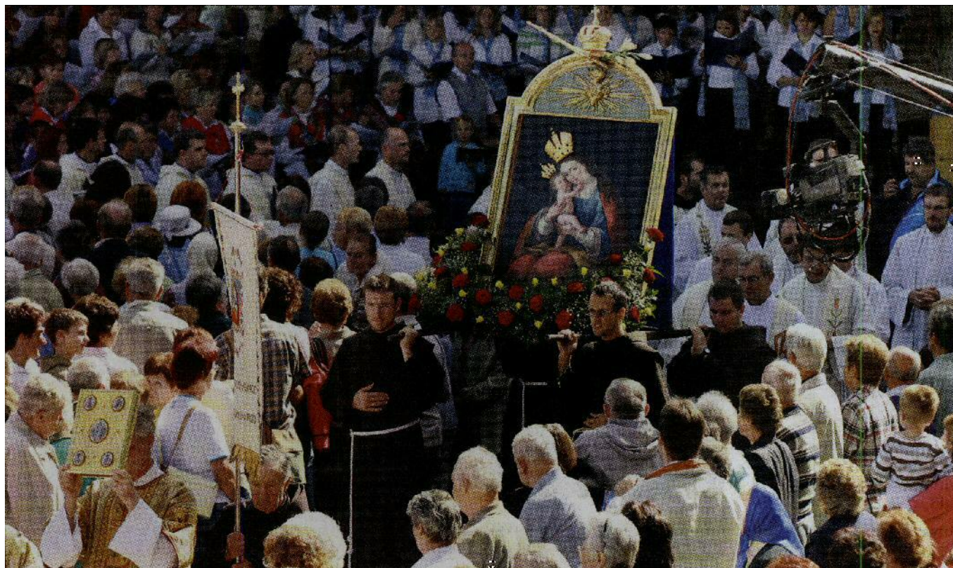
Breže so najbolj obiskan gorenjski in tudi slovenski romarski kraj.